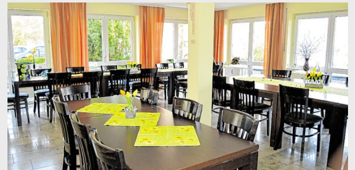
Der neue Sozialraum bietet der Tagespflege Platz für ein Zusammensein in geselliger Runde und ist außerdem ein Treffpunkt für die Bewohner der Seniorenanlage.