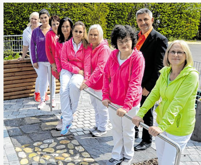
Hochbeete und Barfußpfad – das Team der Tagespflege Burgau freut sich über die neu geschaffenen Möglichkeiten für Senioren im Freien.

Die barrierefreien, lichtdurchfluteten Räume wurden bereits Anfang Dezember bezogen und der Betrieb aufgenommen. Doch nicht nur die Räumlichkeiten wurden auf neuesten Stand gebracht. Auch im Hinblick auf die Mobilität präsentiert sich der Krankenpflegeverein Burgau jetzt stark für die Zukunft: Sechs der 12 Fahrzeuge des Krankenpflegevereins wurden durch E-Fahrzeuge ersetzt. Entsprechende Ladesäulen stehen bereit, um den Fahrdienst der Einrichtung umweltfreundlich zu gestalten. Um das Ende des Umbaus gebührend zu feiern und die Einrichtung allen Interessierten vorzustellen, lädt der Krankenpflegeverein Burgau am Sonntag, 15. Mai, zu einem „Tag der offenen Tür“ in die Bleichstraße ein. An diesem Tag werden die Räumlichkeiten offiziell eröffnet und gesegnet. (ade)