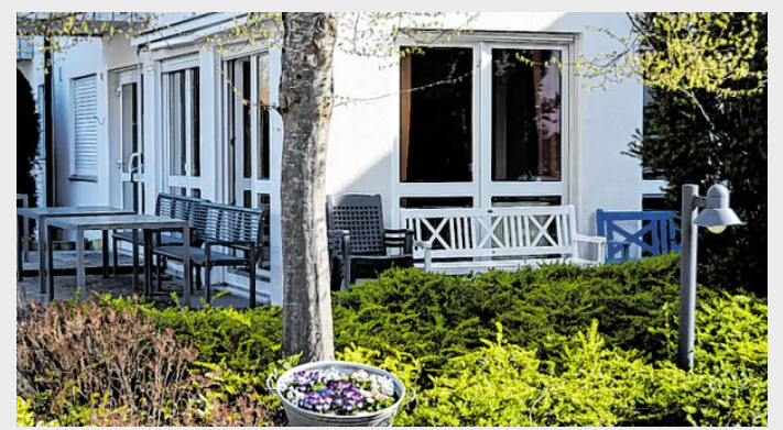
Das „Café an der Bleiche“ mit von den Senioren gepflanzten Frühblühen im Vordergrund.