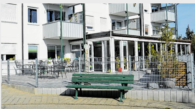
Ein Blick von außen auf den langen Wintergarten der Tagespflege.