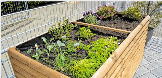
In den zwei neuen Hochbeeten haben bereits Lavendel, Schnittlauch und Kräuter ihren Platz gefunden.